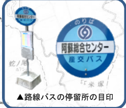
▲路線バスの停留所の目印