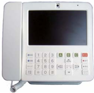
▲お知らせ端末 本体

順次、取付工事を進めています。伝送路の関係や、留守等で(株)九電工と工事連絡がまだ取れていないなどで、「お知らせ端末」の設置時期が近所と異なる場合があります。ご不在が多い方は、連絡がつく電話先や携帯電話の番号を情報課まで教えてください。申込書に携帯番号を記入した方は必要ありません。