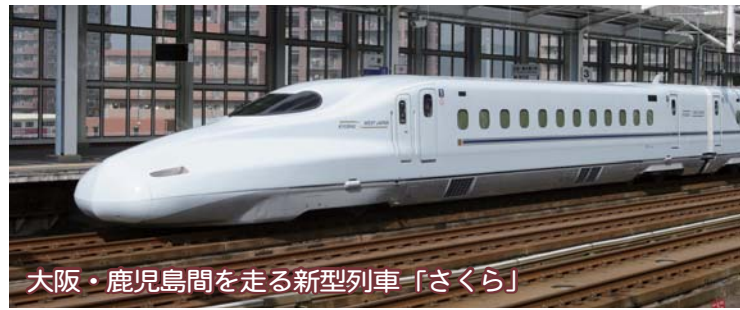
大阪・鹿児島間を走る新型列車「さくら」