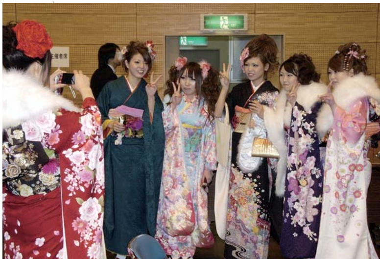
▲式典後、久しぶりに会った友人たちと記念撮影を楽しむ新成人