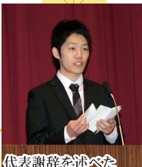
代表謝辞を述べた

二十歳の自分に今できることは何なのかを考え、自分の役割をしっかり果たし、私たちが育ててくれた阿蘇市に恩返ししたい、という決意を述べました。