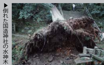
倒れた阿蘇神社の水神木

瞬間最大風速60.9mの台風が阿蘇を直撃。午後4時からの2時間で家屋や農業施設を損壊。手野の大杉はじめ神社の大木が次々と倒れる歴史的な被害。