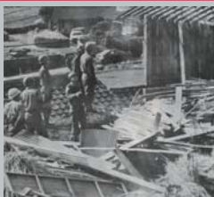
手野の大地震 (昭和50年1月)