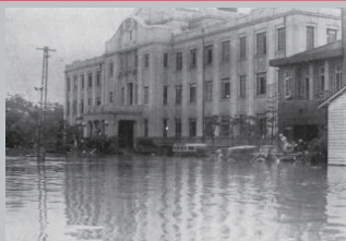
白川大水害 (昭和28年6月)

県北中部を中心に発生した集中豪雨。死者・行方不明者は500人超、家屋全壊は1,000戸を超えた大水害。