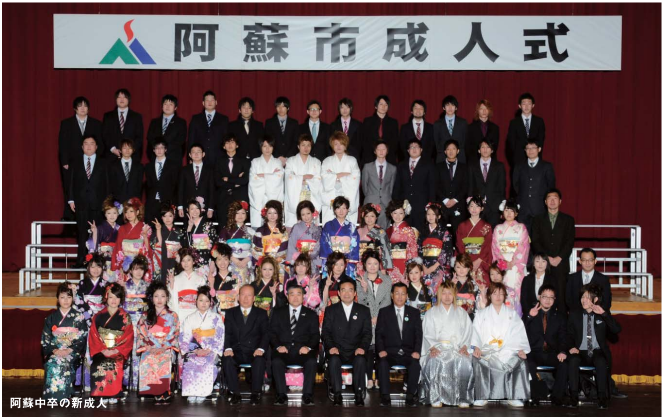
阿蘇中卒の新成人