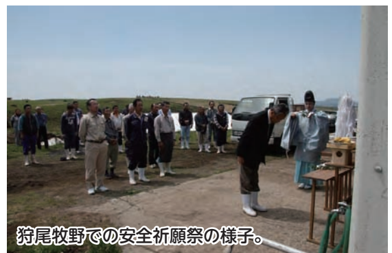
狩尾牧野での安全祈願祭の様子。

熊本県畜産農業協同組合では「熊本型放牧」として、放牧地を持たない農家の牛（繁殖牛）を阿蘇の牧野組合に預け、飼料代や世話する労力を削減し、また、これらの牛を受け入れる牧野の活性化及びその結果つくられる草原の景観維持に取り組んでいます。