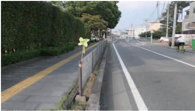
死亡事故現場に掲示される黄色い風車 (イメージ)