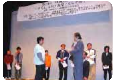
▲堂々の1位！表彰式のもよう

同部門は、これまでの活動内容を発表し競うもので、7団体が参加。『内牧案内人協会』が見事大賞を受賞しました。同協会は、内牧の観光名所旧跡、映画のロケ地をメンバー8人がボランティアで案内しており、内牧の観光振興に一役かっています。