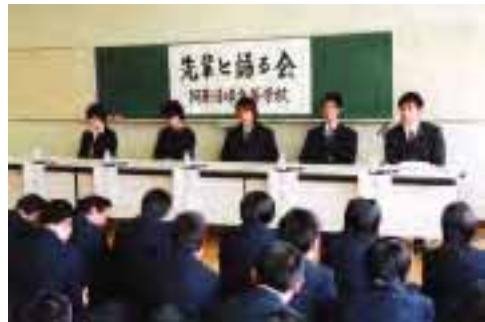
▲先輩の話に真剣に耳を傾ける在校生

阿蘇清峰高校では、先輩の就労体験談や高校在学中に取り組んだことなど「生の声」を聴く「先輩と語る会」を新学期前の時期に行い、在校生の進路意識の高揚を図っています。(本年は3月18日)