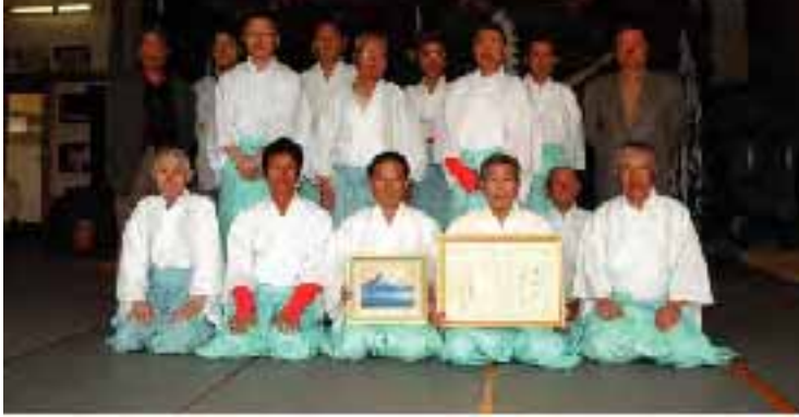
▲中江岩戸神楽保存会の皆さん。今回の表彰を誇りに、「がんばります！」

(財) 伝統文化活性化国民協会から、地域での伝統文化活動の振興に功労があったとして、国選無形民俗文化財「中江岩戸神楽保存会」が地域伝統文化功労者表彰を受け、3月25日に県庁で伝達式が行われました。嘉島町六嘉の獅子舞保存会、荒尾市野原八幡宮風流節頭保存会に続き3団体目。