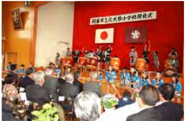
▲全校児童で「役犬原太鼓」の披露。役犬原生として、最後の勇姿に多くの拍手が送られました。

「まとまりのある学校でした。136年の歴史の中には様々な苦悩もありましたが、校区の皆様や歴代の先生方の努力で乗り越えてきました。児童の皆さんは、本校で身につけた豊かな心と確かな力を、今後も発揮して下さい」と式辞。