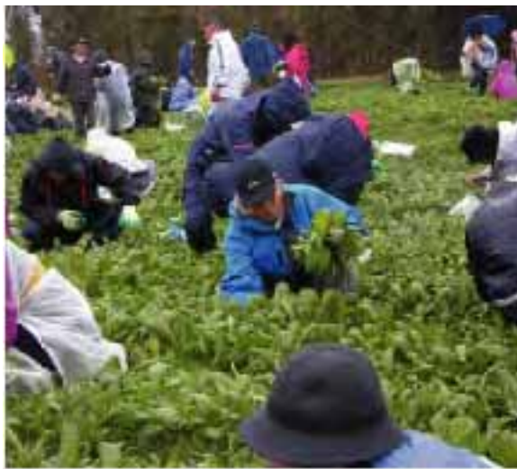
▲雨の中、家族連れで「たかな折り」を楽しむ参加者