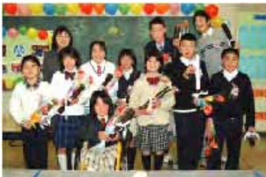
▲多くの方々に見送られ、最後の卒業生10人が学び舎を後に。

その後、関係者が見守る中、記念碑の除幕と記念植樹が行われ、同校を偲ぶ会では、子ども達が学校の歴史や行事を紹介、長年地域の人々に親しまれた学校に別れを告げました。