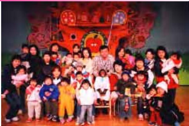
▲テレビでおなじみ チンパンジーのパン君と一緒にハイチーズ!!

皆さんが楽しみにしていたカドリードミニオンへのピクニック。当初予定していた3月23日は、雨・・・そのため、25日に延期。総勢37人で楽しむことができました！