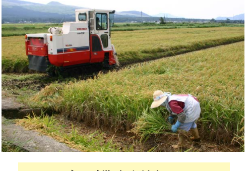
ぜひご賞味ください! ~阿蘇のこしひかり~ 阿蘇市の自然の恵みである豊かな水と清純な空気のなかで育った米「こしひかり」は、食欲を誘う香りと味わい深いところが特長です。

J A 阿蘇が販売している「阿蘇の しず のしず (左)」と「阿蘇の宮こしかり(右)」→