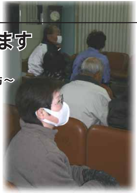
〈冬の感染症の比較〉

寒くて乾燥する冬は、風邪やインフルエンザなどの感染症が流行しやすい季節です。予防の基本は、「石鹸での手洗い・うがい・感染者のマスク着用」です。また、この予防方法は昨年未から全国的に流行している感染性胃腸炎（ノロウイルス）など、どの感染症にも効果があります。日ごろから感染症予防に心がけましょう。