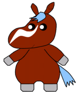
▲熊本地検広報キャラクター「ヒーゴ」