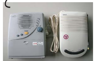
旧阿蘇町地区の戸別受信機

また、古くなった戸別受信機は点検・修理・清掃した後、再利用しますので、転出等の際には必ず返却されますようお願いいたします。