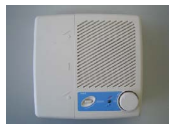
旧一の宮地区の戸別受信機