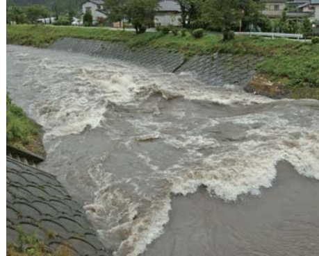
▲増水し流れが速くなった河川（昨年）

災害に備え、市から緊急に防災情報を提供する防災行政無線や避難場所・避難経路の確認をお願いします。