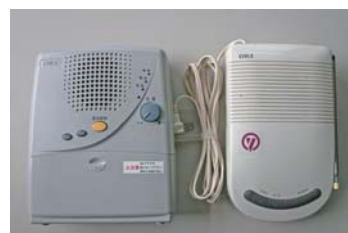
▲阿蘇地区の戸別受信機

また、古くなった戸別受信機は点検・修理・清掃した後、再利用しますので、転出等の際には必ず返却されますようお願いいたします。