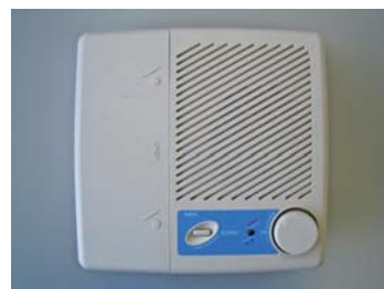
▲一の宮・波野地区の戸別受信機

<問い合わせ先> 総務課防災交通係 ☎ 22-3111 内牧支所総務係 ☎ 32-1111 波野支所総務係 ☎ 24-2001