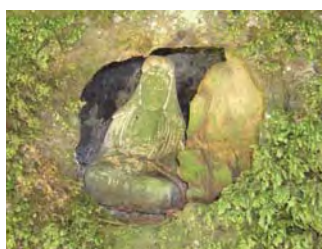
▲浄土寺に鎮座する「穴観音」