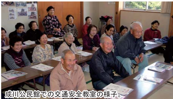
成川公民館での交通安全教室の様子。

「高齢者交通安全教育」の開催を希望される方へ 「高齢者交通安全教室」の開催はいつでも受付をしています。希望する老人会は事務局に申し込みをお願いします。（☎22-5110 内線442）