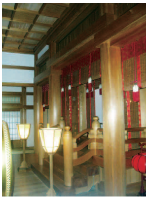
ナンゴウヒ（上）と、ナンゴウヒで建てられた建築物（下）