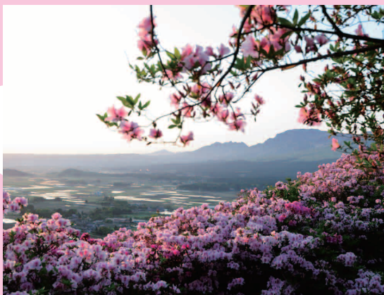
長寿ヶ丘公苑のつつじ