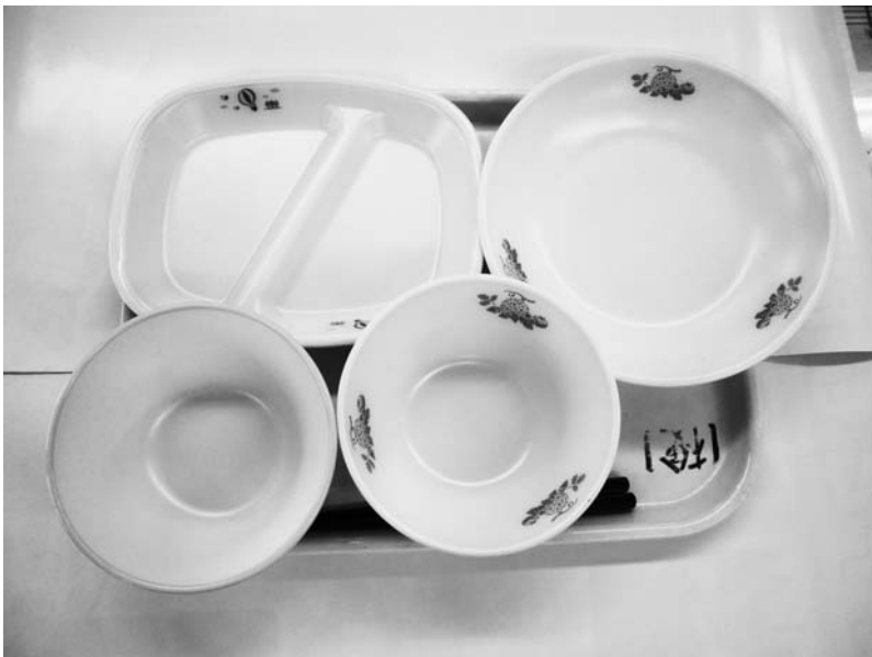
新しくなる阿蘇給食センターの食器（サンプル）

答 透析患者送迎用の車両購入費として160万円が組まれており、中古車を購入するとのことだが、新車で300万円程度というのであれば、病院がいくら赤字経営であっても、そこまで辛抱しなくても良いのではないかと、病院長が厳しく、日ごろから節減できるものは節減しています。