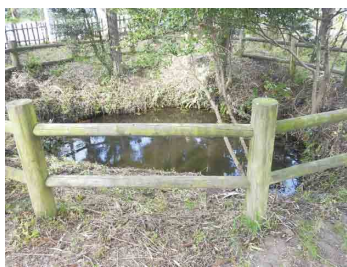
小池七池の案内のようす

小池の池のほとりに差し掛かった時、姫が水を飲みたいと言ったので輿を止めたところ、姫は降りて池のそばまで行って、何を思われたか突然身を翻して池に飛び込み、みるみるうちに蛇身と化して池の中に沈んでいった。成り行きに動転した腰元たち6人も悲嘆のあまり次々に入水して全て大蛇となったという。