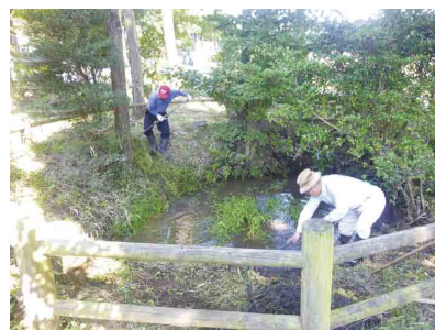
清掃活動のようす

平成17年度から、ASO田園空間博物館とともに地域散策イベントを年数回開催しています。他にも小池七池のうち赤池、鶴池の清掃活動を年2回行っていきます。さらにASO田園空間