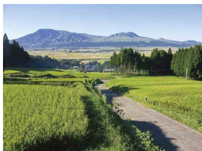
景観がすばらしい山田水掛棚田

第10回目は、サテライトである乙川湧水群や棚田を管理されている山田地区有志の方々、そして、伝説の残る小池七池を管理されている小池地区有志の方々2つのグループの皆さんにお話しを伺いました。