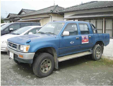
公売物件（トヨタハイラックス）