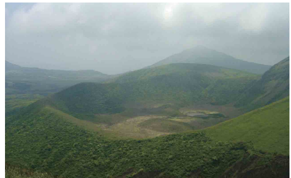
ふるのみいけ 古御池（東麓の火口） ※読み方には諸説あり。

阿蘇五岳の中では西側、涅槃像の膝あたりに位置する杵島岳は約3,500年前の噴火によりできた山です。若い火山であるため、侵食を受けていない、なだらかな山のかたちと噴火による地形を多く残していることが特徴です。たくさん火口や、噴火活動の跡を見ることができます。天気が良ければ頂上から阿蘇カルデラ北部を一望でき、山のかたちの違いから時間の経過をたどることもできます。