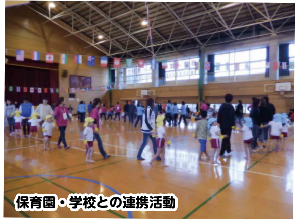
保育園・学校との連携活動