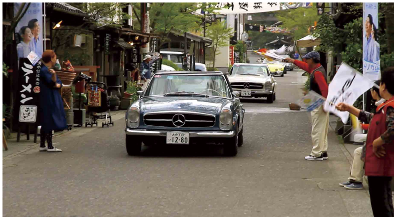
門前町商店街を訪れた名車を歓迎する地元住民たち

スタンプラリーイベント「チェント・ミリアかみつえ」が4月18日から19日にかけて行われ、約60台の世界の名車が熊本・大分県の観光地を周遊し、一の宮門前町商店街にも勢ぞろいしました。 このイベントは、自動車の周遊を通して県内各地の観光地紹介や地域住民との交流、交通安全啓発などを図ろうと、平成13年から毎年行われているものです。18日夕方にラリーカーが同商店街に訪れると、地域住民や観光客らは旗を振って歓迎。ドライバーとの触れ合いを楽しみました。