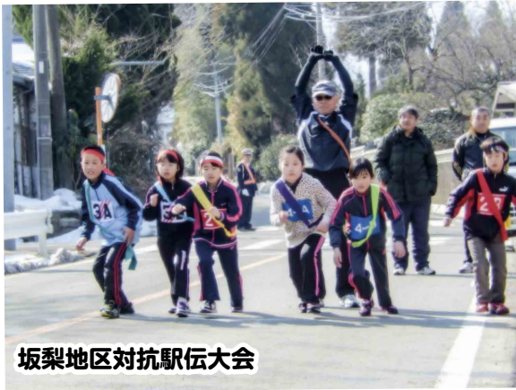
坂梨地区対抗駅伝大会

梨分館では、子どもたちの健全育成を目指し、自立心を持った思いやりのある優しい子どもを育てていくという目標のもと、保育園、学校との連携活動として、メッセージ入りの風船飛ばし、人形劇の鑑賞、そば打ち、3333段の石段上りなどの体験活動や恐竜館見学など、さまざまな活動を行っています。また、各種団体との連携活動としてラフティング、ソフトバレー大会、坂梨地区対抗駅伝、馬場八幡大祭前夜祭などを実施しています。 分館活動において、子どもを対象とした活動は欠かせません。これまでは保育園、小学校と協力して活動を行ってききましたが、来年度からその小学校が閉校となるため、今後は地区に3団体ある子ども会との連携などの体制づくりを行う予定です。