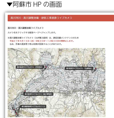
▼阿蘇市 HP の画面