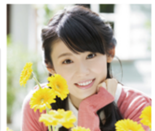
しんくみイメージキャラクター 本館藤ユイカ