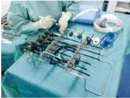
(上)使用する器具(鉗子) (右)手術の様子