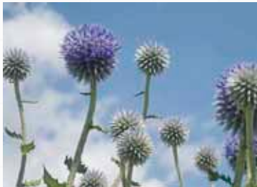
かつて九州と中国が陸つながりだったことを伝えてくれる生き証人「ヒゴタイ」

世界には、ヨーロッパやアジアをはじめとする33カ国120地域のユネスコ世界ジオパークがあり、日本には、43地域の日本ジオパークがあります(うち、8地域はユネスコ世界ジオパーク/平成28年9月現在)。阿蘇のような火山がテーマのジオパーク、大地の隆起や氷河で形成されたジオパーク、恐竜がいたジオパークなど、各ジオパークには、地域特有のストーリーがあります。その地域のストーリーをつないでいくと、私たちが共有するひとつの地球の46億年もの壮大なストーリーを辿ることができます。ジオパークネットワークは、地球規模での課題解決が必要な環境問題や自然災害、国際平和において、大会、研修など交流の場を盛んに持ち、知識や経験を共有し、地球を住みかとする私たちの持続可能な暮らしを一緒に考えることができるのが強みです！