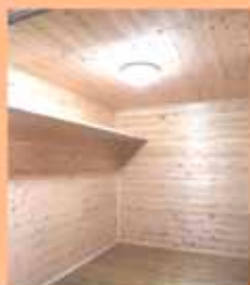
無垢材の収納内部です