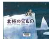
ダナ・スミス / 文 (あすなろ書房)

昼間も暗い北極の冬。ここにしかないたいせつな宝ものとは？北極圏に生きる人々の暮らしと、オーロラを心待ちにする少女を描いた美しい絵本。