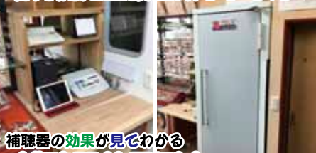
補聴器の効果が目でわかる