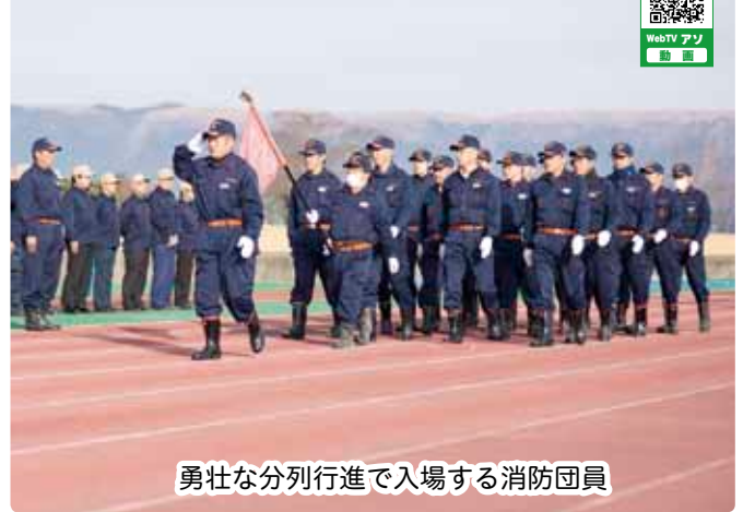
勇壮な分列行進で入場する消防団員