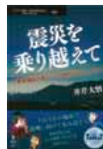
井芹大悟 / 著 (インプレス R & D)

熊本地震を家族がどうやって乗り越えてきたのか、ボランティアはどのような支援をしてきたか、阿蘇市在住の著書が日々の記録を通して語る。