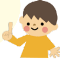
阿蘇医療センター内にある 保育施設「すずらんルーム」

子どもが病気の治療中や回復期で、集団保育が困難で、かつ、保護者がやむを得ない事情によりご家庭で保育ができない場合に、一時的に施設で保育する制度です。