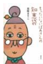
真珠まりこ / 著 (講談社)

季節の風習や伝統行事、和の文化、昔ながらの知恵などを紹介しながら、「もったいない」という思いを描いた『毎日新聞』連載「もったいないばあさん日記」に加筆し書籍化。伝えたい和の心や丁寧に暮らすヒントが満載。