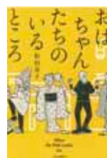
松田青子 / 著 (中央公論新社)

「わたしたち、もののけになりましょう」追いつめられた現代人のもとへ、八百屋お七や皿屋敷のお菊が一肌脱ぎにやってくる。愉快的連作短編集。