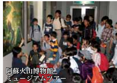
阿蘇火山博物館 ミュージアムツアー

起こる豪雨や地震など地球の活動の恐さと恵みを生み出すありがたさやおもしろさを同時に味わえる空間です。12月にリ