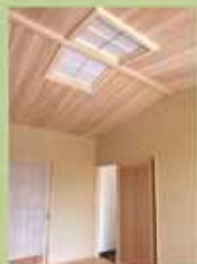
小国杉をつかっています