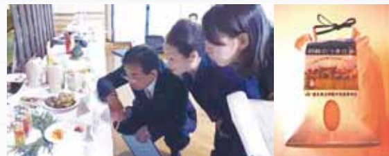
(左)認定審査会の様子 (右)認定を受けた「阿蘇のうまか米」

まずは、阿蘇ユネスコジオパークの公式ホームページから商品をご覧ください、阿蘇ジオパークブランド巡りを楽しんではいかがでしょうか？