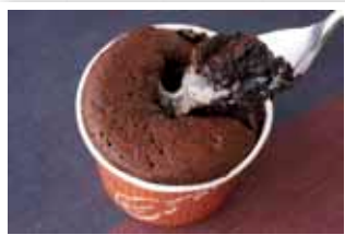
菓心なかむら 中岳ショコラ

火山をイメージした、楽しいフォンダンショコラ。レンジで10秒チンすると、中からまるで溶岩のようにとろりとお餅が流れます。