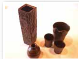
工房ゆう 阿蘇中岳火山灰釉陶器

中岳の火山灰を釉薬に、阿蘇黄土を粘土に使用し、阿蘇ならではの独特の風合いを楽しめる器。