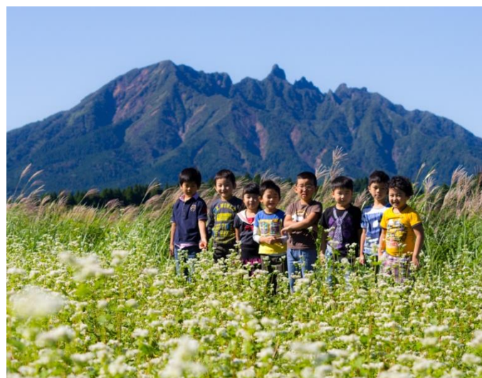
波野高原に咲く満開のそば畑