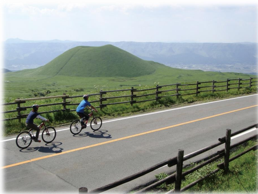
阿蘇サイクルツーリズム