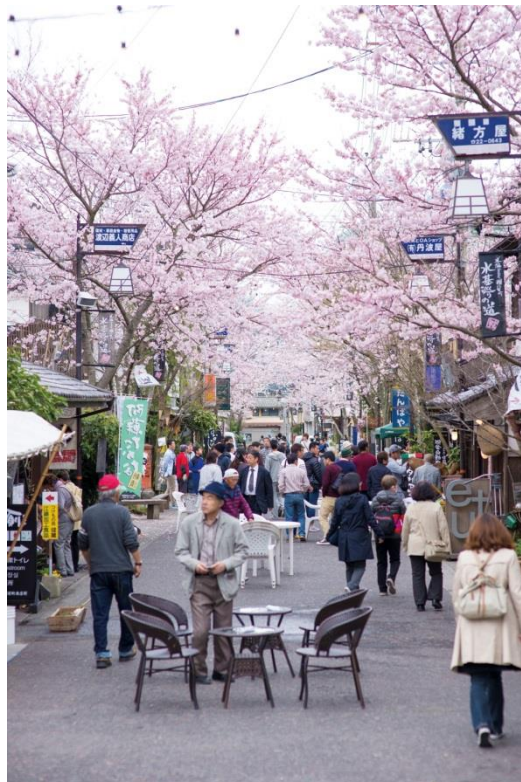
阿蘇一の宮門前町商店街のイベント