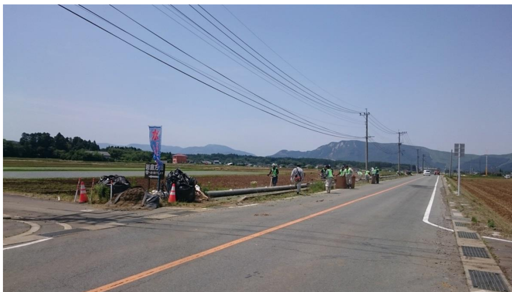
水道週間清掃ボランティア作業