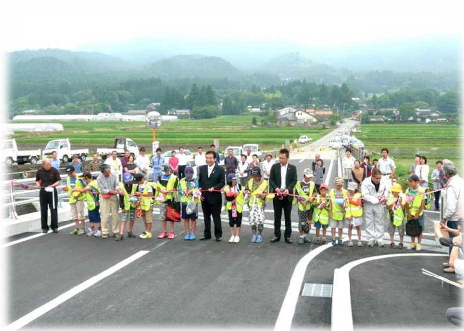
災害で落橋した橋が完成（山田橋）