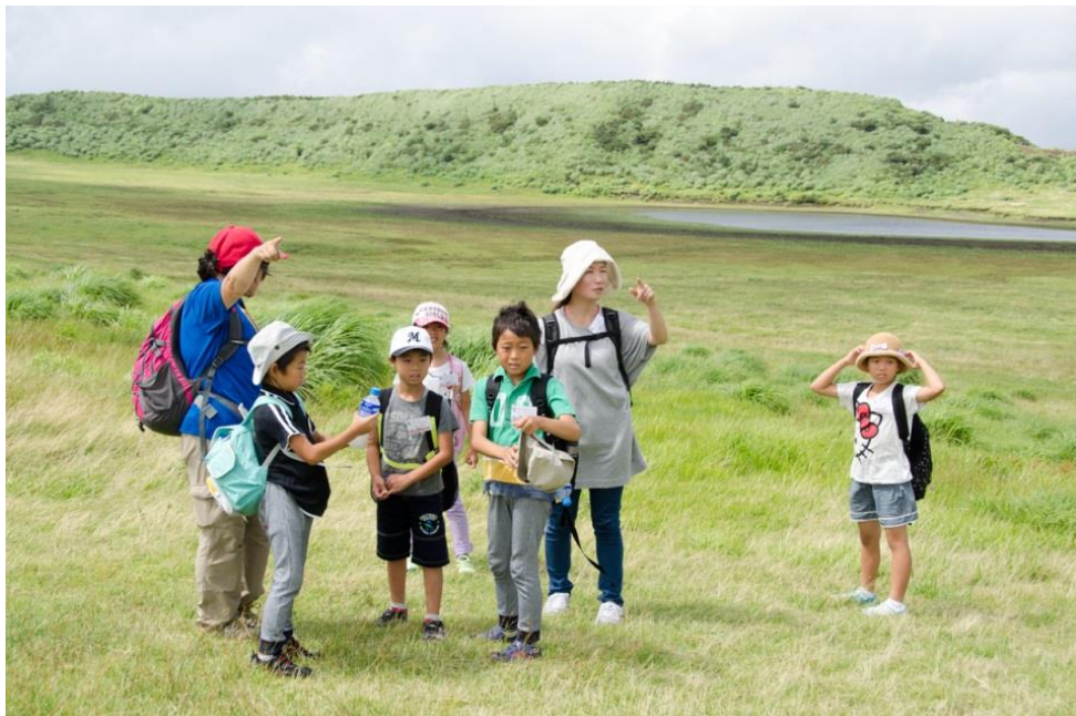
A S O環境共生基金を活用した自然観察学習会