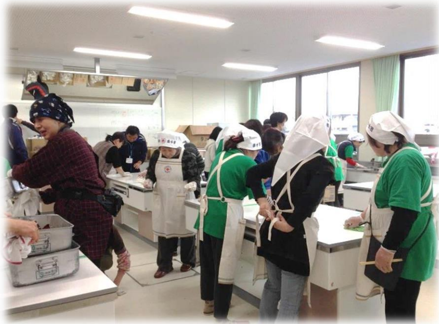
指定避難所での炊き出し支援