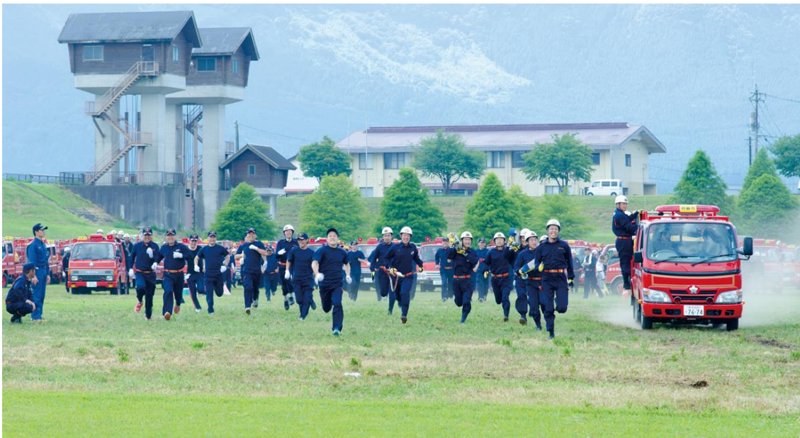
消防団標的落し競技大会

市民生活に身近な福祉・保健・戸籍・税務等に関する窓口業務や、市道・市営住宅の簡易的な管理に関する業務など、本庁各部署の総合窓口としての支所機能を効率的に維持し、多種多様化する市民ニーズに対する行政サービスの利便性の向上に努めます。