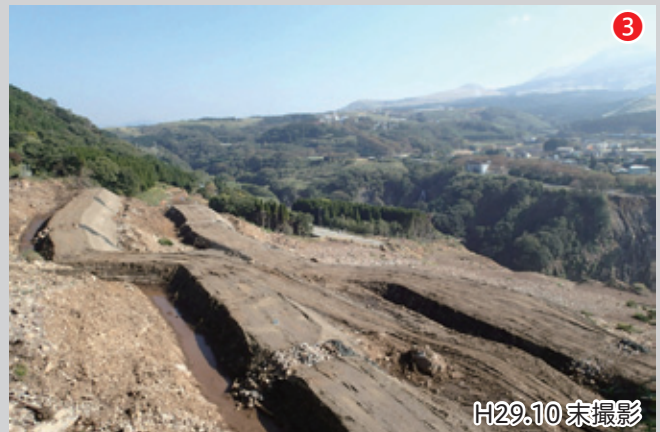
斜面中腹の土留盛土。斜面上部に残る不安定土砂の崩壊による二次災害を防ぐものである。昨年 1 月から斜面下部で有人による作業が可能となっている。