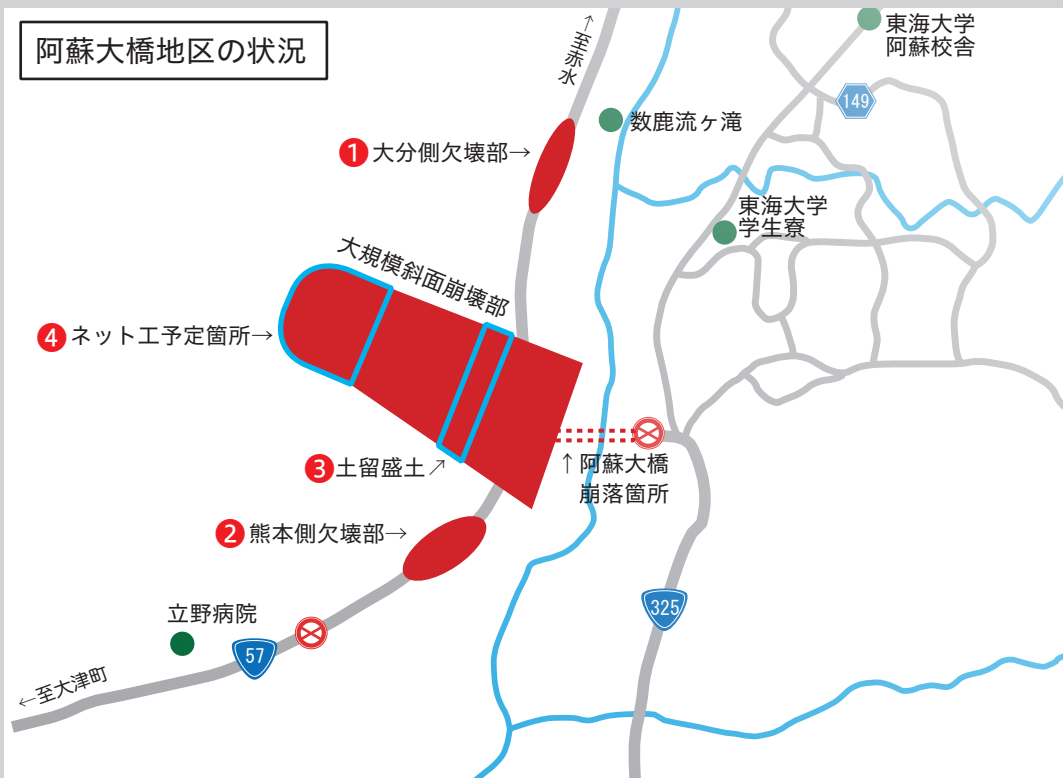
この部分が主な被災箇所