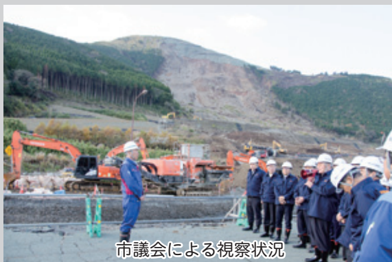
市議会による視察状況