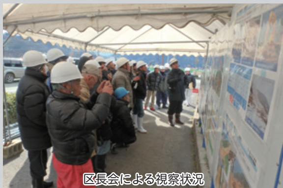
区長会による視察状況