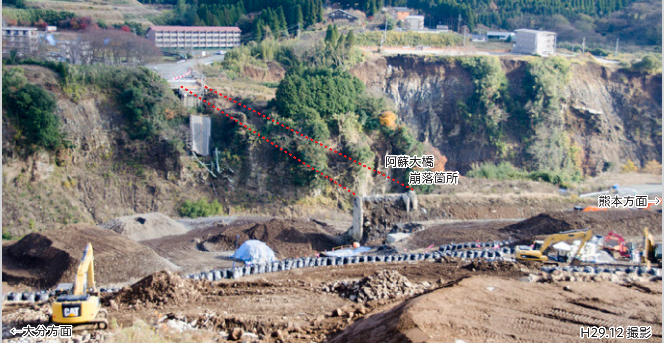
国道 57 号側から見た南阿蘇方面。奥に見える阿蘇大橋崩落箇所周辺でも土砂崩落が確認できる。写真手前の土砂崩壊現場では、以前は 1km 離れた場所からオペレーターが無人化重機を操作して土砂撤去作業を行っていた。斜面上部の不安定な土砂を撤去し土留盛土を造ったことで、現在、土留盛土下部では人が乗った重機による土砂撤去作業が可能となった。