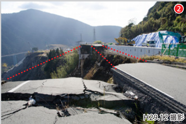
熊本方面へ向かう国道 57 号（阿蘇大橋と立野病院の間）。道路下の地盤が崩れ 4 車線のうち 3 車線が崩壊している。 ① の大分側と同様に欠壊防止工事が進められている。写真右部はブロックを設置して欠壊を防いでいる。