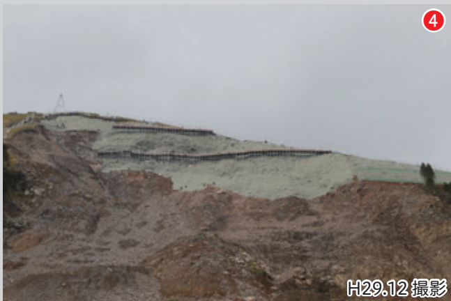
崩壊した斜面の上部。堆積していた不安定土砂の撤去が終わり斜面の恒久的な安定化を図るための工事を施工中。斜面の強度を調査しながら進めるため完成までに長期の工事が見込まれている。