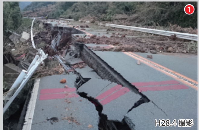
被災直後の大分側国道 57 号（赤水方面から阿蘇大橋に向う途中）。2 車線のうち 1 車線がえぐられた状態。更なる浸食を防ぐために欠壊防止工事が進められている。