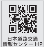
日本道路交通情報センター HP

「日本道路交通情報センターホームページ」 （HP トップ→熊本→規制一覧で閲覧可能）