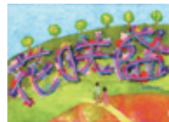
ながお たかこ / 著 (星雲社)

阿蘇の外輪山でおじさんとおばさんが、「あのあたりの木を切って、お花畑にしたいな」と相談しました。2人が毎日山に通ってきれいにすると、次の年の春、草や木が芽を出しはじめて…。和紙の貼り絵の絵本。