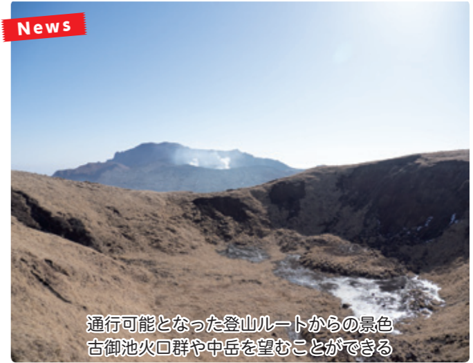
通行可能となった登山ルートからの景色 古御池火口群や中岳を望むことができる

熊本地震などの影響で一部通行不可となっていた杵島岳で、1月11日からすべての登山ルートが通行できるようになりました。これまで杵島岳の登山ルートは山頂まで登山が可能でしたが、一部で崩落や亀裂が発生し山頂から先の古御池火口群を望むルートが通行できませんでした。今回、危険箇所を設置するための案内板やロープを設置するなどの安全対策を実施。杵島岳山頂から火口縁を周遊する御鉢巡りが可能となりました。中岳、高岳のルートは山上の安全対策が確認され次第、登山が可能となります。 阿蘇市役所観光課 ☎ 22-3174