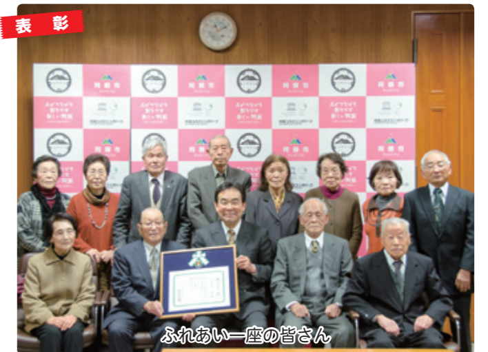
ふれあい一座の皆さん