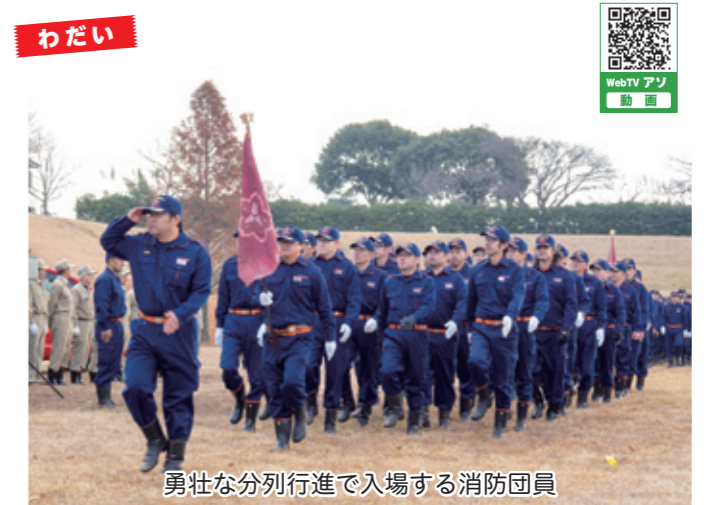
勇壮な分列行進で入場する消防団員