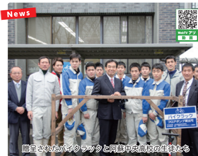
贈呈されたバイクラックと阿蘇中央高校の生徒たち