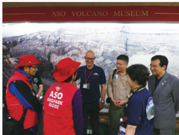
4年前のユネスコ世界ジオパーク認定審査の様子(左:中岳火口、右:阿蘇火山博物館)