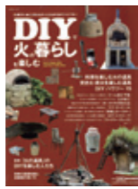
CHIKYU-MARU MOOK 自然暮らしの本 (地球丸)

火を楽しむ場づくりや道具づくりを工夫し、「火の暮らし」を楽しんでいる達人たちのDIYライフを紹介。また、ピザ窯、ロケットストーブなどの基礎知識やつくり方を写真や図で説明する。