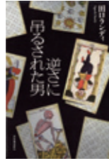
田口 ランディ / 著 (河出書房新社)

地下鉄サリン事件実行犯の外部交流者となった作家・羽鳥よう子。面会や手紙のやりとりを重ねるうちに、「真実に辿りつける」と確信した羽鳥は、小説で独自のオウム解釈にのめりこむが…。