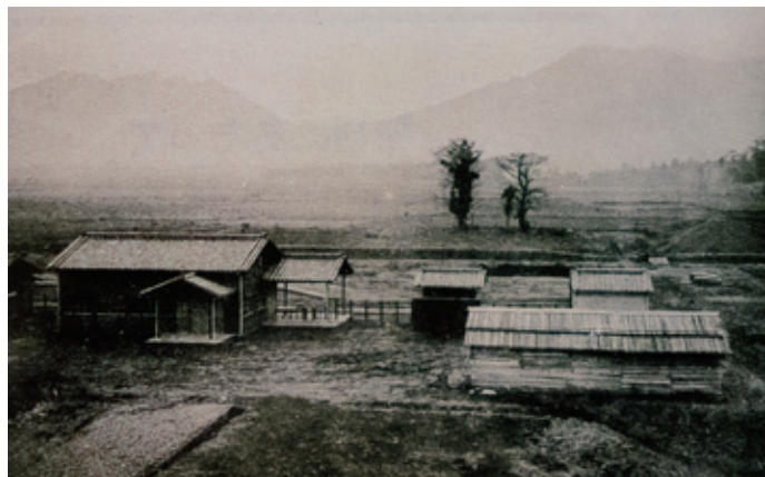
開業当時の宮地駅

現在の駅舎は、昭和19年に増改築されたもので、スイスの登山鉄道を参考に山小屋風に造られています。