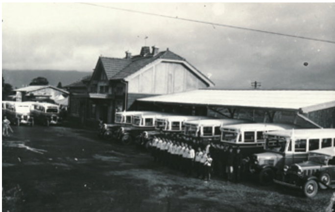
昭和初期の坊中駅(現阿蘇駅)