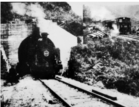
開通当時立野トンネルを通過するSL

鉄道が整備されたことで、物流も増加。貨物列車には米をはじめ木材、酒、醤油、塩干魚、雑貨、反物類などが熊本方面から持ち込まれるなど、阿蘇の産業発展に大きな影響を与えました。