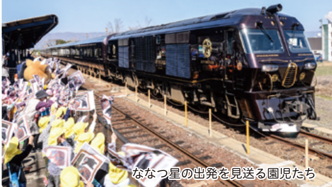
ななつ星の出発を見送る園児たち