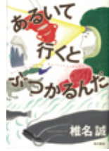
椎名 誠／著 (KADOKAWA)

世界中の様々な場所を旅してきた行動派作家の椎名誠が、旅先でぶつかったコト・モノ・ヒトについて、自身の経験や読書体験から考察を深めていく痛快エッセイ集。『本の旅人』連載に加筆し単行本化。