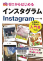
リンクアップ／選 (技術評論社)

ユーザーとのつながり方、写真の加工・投稿のしかた、インスタ映える写真の撮影テクニックなど、写真投稿SNS「Instagram」の使い方を、画面写真とともに紹介する。困ったときの解決技も収録。