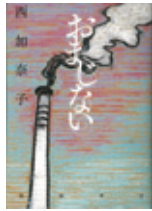
西 加奈子／著 (筑摩書房)

少女、モデル、キャバ嬢、レズビアン…。社会の価値観に縛られ、「生きづらさ」を感じている「女の子」たちが「おじさん」のなにげない一言で救われ…。全8編を収録。