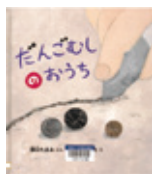
澤口 たまみ／文 たしろ ちさと／絵 (福音館書店)

女の子がだんごむしをたくさんつけました。まわりを線で丸く囲んで、だんごむしのおうちをつくりまわす。あっ、一匹のだんごむしが外に出ようとしています。すると女の子は…。『ちいさなながくのとも』から生まれた絵本。