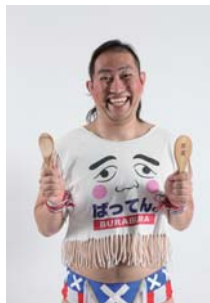
ぼってん×ふらふら