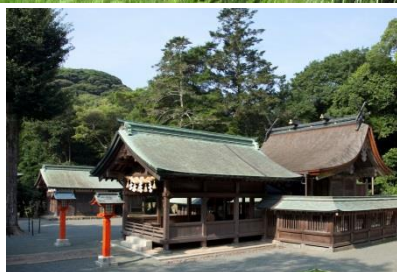
宗像大社中津宮 (大島)