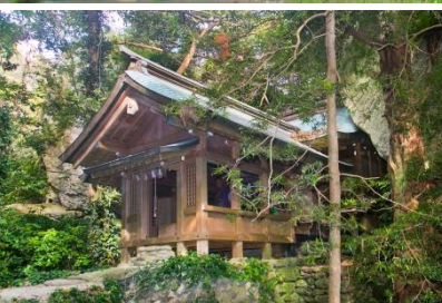
宗像大社沖津宮 (沖ノ島)