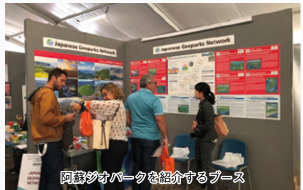
阿蘇ジオパークを紹介するブース