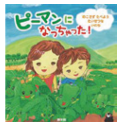
絵本 「ピーマンになっちゃった!」