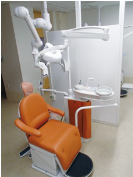
歯科口腔外科の診察台

阿蘇圏域には、歯科口腔外科を開設している病院がなく、侵襲性の高い外科処置はもとより、全身のがん診療や高齢化に伴う全身との関わりが深い歯科治療ができず、入院加療を要するような歯科医療を受けるには、患者様は、熊本市内まで通院せざるを得ない状況でした。 このような中、当院に歯科口腔外科を開設することができました。今後、阿蘇圏域の皆さまが等しく歯科口腔外科の治療が受けられるようになります。 歯科口腔外科は、歯科口腔領域の特殊な疾患や外科治療と院内の患者様の周術期口腔管理や口腔健康管理に対応することが主な業務となります。 当院歯科口腔外科は、地域の歯科医院・医療機関と連携を図り、口腔領域の疾患に対して、安心・安全な治療と口腔管理を提供します。