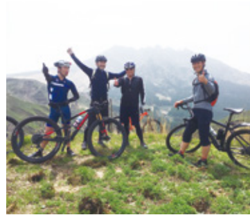
雄大な草原を満喫！