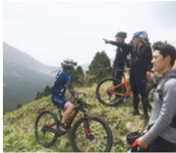
草原や希少動植物について学ぶ