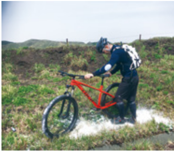
伝染病予防のため牧野入口で消毒

コギダス協議会では、自転車の活用によって阿蘇の豊かな草原を未来に引き継いでいくために、「牧野ライド」の取り組みを支援しています。阿蘇でしか体験できないサイクルツーリズムによる草原の保全と活用の取り組みを推進し、普段立ち入ることができない牧野に特別に入ることが許可されたガイドと一緒に阿蘇の原野でサイクリングを楽しめる「牧野ガイドツアー」が昨年12月からスタートしています。