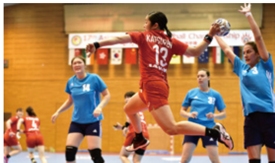
▲試合でシュートを打つ勝連選手