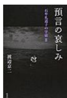
渡辺 京二/著 (弦書房)

石牟礼道子の遺した預言とは何か。そして彼女はどこへ帰っていったのか。2018年2月10日に死去した石牟礼道子とともに歩み闘った著者が、石牟礼道子像とその作品に込められた深い含意を伝える。