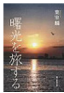
葉室 麟/著 (朝日新聞出版)

歴史の裏通りや路地を歩きたい…。ひたむきに時代を見つめ続けた著者による、九州から京都を中心にした旅エッセイ。連載前の構想を綴った「葉室メモ」も初公開。