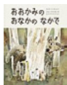
マック・パーネット/文 (徳間書店)

おおかみに食べられたねずみは、おなかのなかで、あひると出会いました。元の世界に戻りたくないという、あひる。ねずみはおおかみのお腹の中であひると暮らすことに…。ユーモアあふれる絵本。