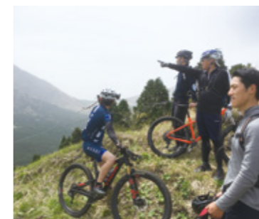
草原や希少動植物について学ぶ