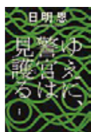
日明 恩/著 (双葉社)

連続殺人 & 放火事件が世間を騒がすなか、新宿署にひっそりと勾留された、柏木という男。留置管理者の武本は、なにも語らず動じない彼に不審を覚え…。