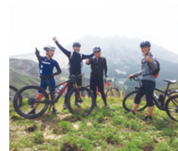
雄大な草原を満喫！