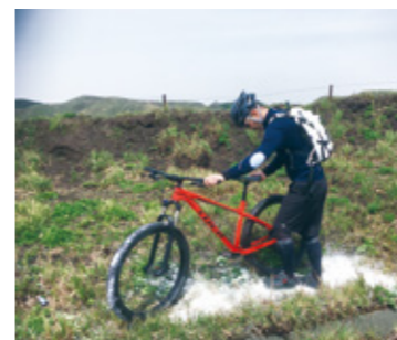
伝染病予防のため牧野入口で消毒

「世界農業遺産」や「世界ジオパーク」に認定されている阿蘇地域には、約2万2千haの広大な草原が広がっています。阿蘇の草原は、古くから人と自然が上手に共生してきた証であり、その景観は多くの人々の心をひきつけています。希少な動植物の宝庫ともなっています。