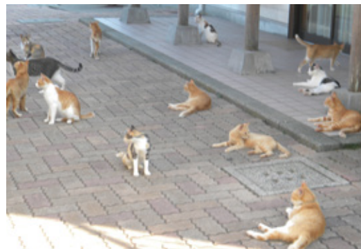
管理できないほど増えた猫たち

猫たちは他の家にも行って迷惑をかけるので、Aさんのもとには苦情が来ます。しかし、Aさんは猫を飼っているつもりはなくエサを与えているだけと主張します。そのうち、増えすぎた猫に手が