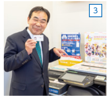
3 マイナンバーカードを使って操作開始!