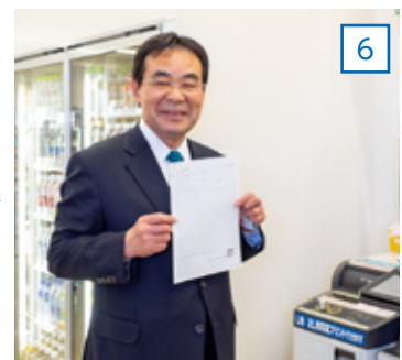
6 画面の案内に従って簡単に証明書を取得できました