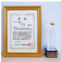
▲表彰状とトロフィー