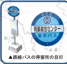
▲路線バスの停留所の目印