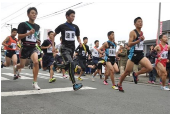
地域対抗市民駅伝大会