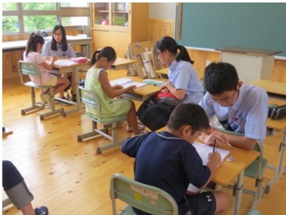
高校生を講師に迎えたサマースクール