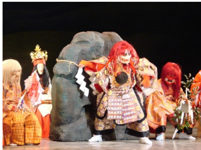
波野子ども神楽部

心豊かな阿蘇市民を育成するため、意欲的に学習に励むための必要な教育条件を整え、すべての子どもたちに確かな学力、豊かな心、健康やかな体を育むための学校教育をしっかりと支援しています。