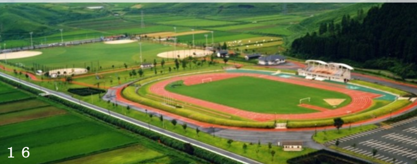
阿蘇市立阿蘇体育館

各種スポーツ・イベントなど幅広く利用できる多目的グラウンドや陸上競技場、ちびっこ広場、弓道場などがあり、地元のクラブ活動、県内外からのスポーツ大会・合宿等で利用されています。