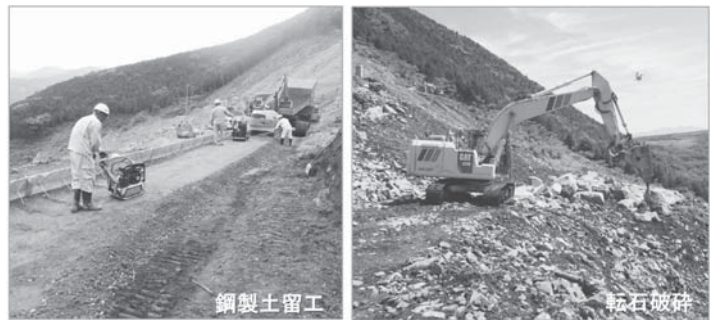
《土留盛土上部》鋼製土留工、転石破碎 施工中