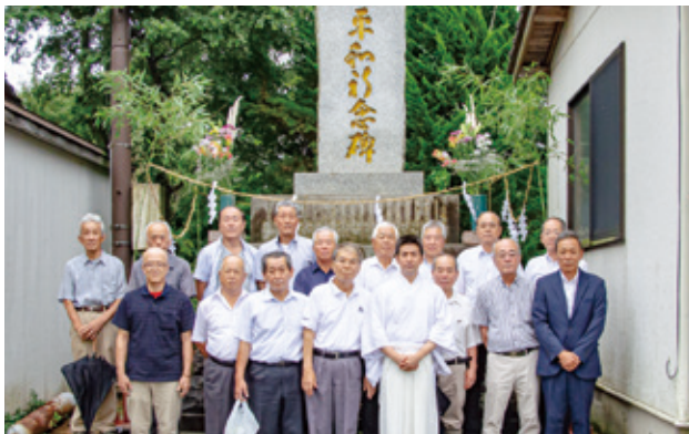
慰霊祭に参列した区民の皆さん