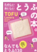
ダンノ マリコ/著 (朝日新聞出版)

冷奴や麻婆豆腐などの定番おかずはもちろん、ヴィーガンレシピや世界の料理まで、幅広く使えるとうふ料理を紹介する。おからドーナツやクッキー、プリンといったスイーツのレシピも収録。