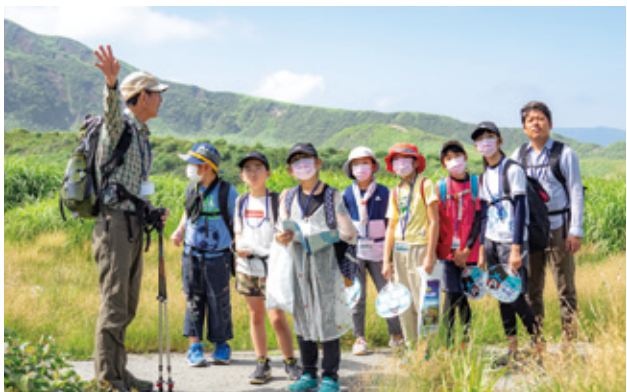
火山灰が降る中マスクを着用して杵島岳の麓を散策した

阿蘇の自然の素晴らしさを学ぶ体験イベント「夏のジオサイトと阿蘇火山博物館」が草千里一帯で開かれ、県内外の家族ら約120人が参加しました。阿蘇の自然環境を維持する「ASO環境共生基金」の体験事業として毎年開催している自然学習会で、参加者は草千里や杵島岳を散策し火山活動や自生する生き物についてガイドから説明を受けました。下山後は火山博物館で、阿蘇山で起きた噴火の話やカルデラを作る実験ジオラマなどを使って阿蘇火山の誕生について学びました。