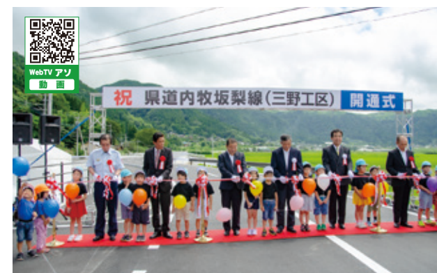
古城保育園の園児も参加し古城郵便局前でテープカット

県道内牧坂梨線三野工区の開通を祝い、古城体育館で開通式が行われ、地元区長や工事関係者など約70人が参加しました。今回完成した道路は、古城郵便局から東側2キロの間で、生活道路として利便性が向上することに加え、災害時の避難路や緊急車両の円滑な通行を想定して車道2車線と歩道が確保されています。県道内牧坂梨線の工事は、国造神社・坂梨の国道57号交差点まで約8キロにわたり計画され、今後も手野工区と北坂梨工区の工事が進められます。