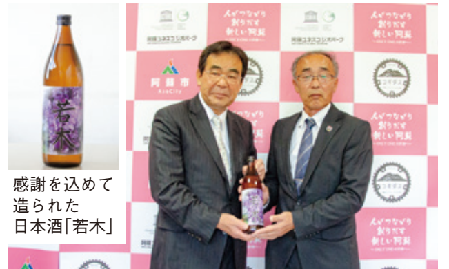
感謝を込めて 造られた 日本酒「若木」