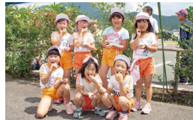
おいしそうにブルーベリーをほおぼる園児

阿蘇内牧ファミリパークあそ☆ビバに植えられたブルーベリーが実り、阿蘇中央幼稚園の園児43人が完熟した実を収穫しました。 子どもたちに喜んでもらうと、同施設を管理するASOワークネットが毎年地元園児を招待している収穫体験で、園児たちは暑さも忘れ、夢中でブルーベリーの実を摘み取りました。 収穫されたブルーベリーは、お土産として園児に渡されたほか、市内の介護老人福祉施設にも届けられる予定です。