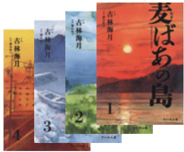
古林海月/作・画 蘭由岐子/監修 すいれん舎

所・邑久光明園を訪問し、入所者・退所者らと交流を重ねながら本書を執筆しました。ひとりでも多くの方に知っておいてもらいたい一冊です。