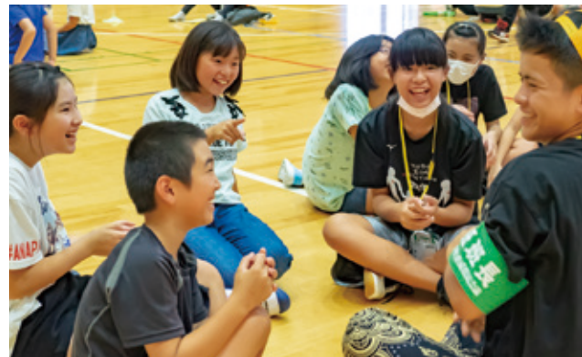
沖縄の子どもたちとゲームなどで交流を深めた

7月31日～8月4日に沖縄の小中高生180人が阿蘇を訪れる「青少年フレンドシップイン九州」の交流事業が実施され、8月2日に一の宮小学校で交流会が開かれました。迎え入れた一の宮小中学校の児童・生徒は、阿蘇の習慣や学校での生活を発表。沖縄の子どもたちは伝統芸能「エイサー」を披露し、互いの文化を交歓しました。班ごとに分かれての名刺交換やゲームで交流を行うと、最初はよそよそしかった子どもたちも次第に打ち解け合い、笑顔で会話を楽しみました。