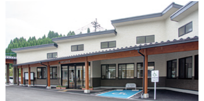
波野支所の外観。屋根は阿蘇の野山をイメージ