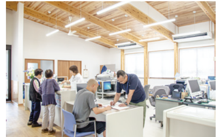
木の香りに包まれた波野支所の窓口風景