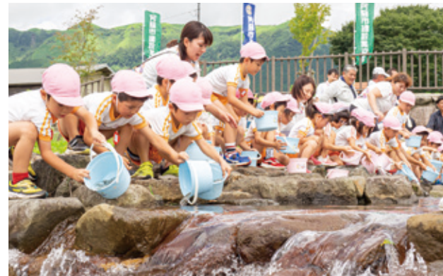
ヤマメの稚魚を放流する園児たち

河川の環境資源を保護するため、西湯浦のかげろん公園で阿蘇中央幼稚園の園児35人がヤマメの稚魚を花原川に放流しました。園児たちの思い出作りと、阿蘇の自然に親しみをもち、将来地元企業で働いてもらいたいという思いから、市商工会と市建設業協会が初めて企画した取り組みで、約10匹のヤマメの稚魚を2千匹用意。園児たちはバケツから飛び出すようにする稚魚に悪戦苦闘しながら、公園内の川岸に並んで一斉にヤマメを放ちました。