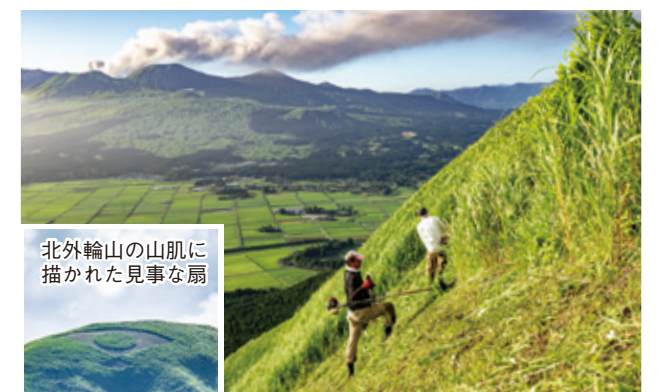
北外輪山の山肌に描かれた見事な扇