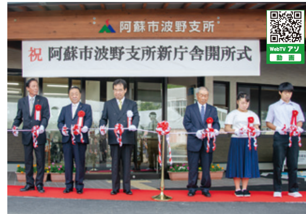
テープカットには地元区長会長と波野小中学生も参加

昨年9月末に着工した波野支所の新庁舎が完成し、関係者70人が出席して開所式が行われました。新しい波野支所の庁舎は、木のぬくもりを感じられるよう県産材を使用した木造平屋建て。車椅子にも優しい屋根付きの障がい者用駐車場や段差のないフロア、多目的トイレには手すりが付けられオストメイト(人工肛門・人工膀胱保持者)にも対応しています。隣接する保健福祉センターとの間には連絡通路が整備され、施設を一体的に利用できます。