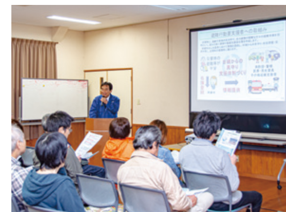
昨年の市政報告会の様子