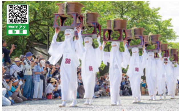
神幸行列の周りには大勢のカメラマンが待ち構える

国指定重要無形民俗文化財である阿蘇の農耕祭事の一つ、「御田植神幸式（御田祭）」が7月26日に国造神社で、28日には阿蘇神社で行われました。それぞれの神社で神事が行われた後、神職や早乙女を乗せた馬、白装束で神様の食事を運ぶ宇奈利、神様が乗る神輿を担ぐ駕輿丁、田植え人形を持った小学生などの神幸行列が集落や青々しい田園の中を練り歩き、五穀豊穡を祈願しました。神幸行列の近くでは、観光客やカメラマンなど多くの人達で賑わいました。