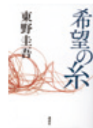
東野 圭吾/著 (講談社)

閑静な住宅街で小さな喫茶店を営む女性が殺された。捜査線上に浮上した常連客だったひとりの男性。災害で二人の子供を失った彼は、深い悩みを抱えていた。容疑者たちの複雑な運命に、若き刑事が挑む。