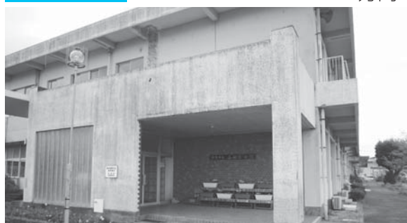
仮設移転先となる旧山田小学校