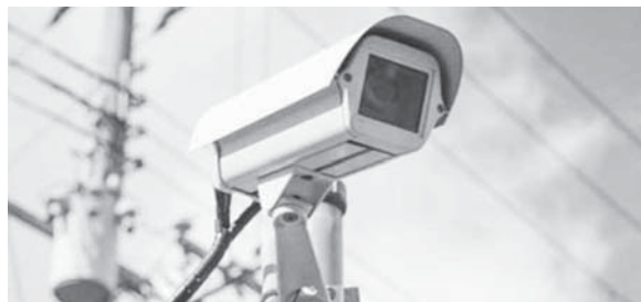
防犯カメラ（イメージ）